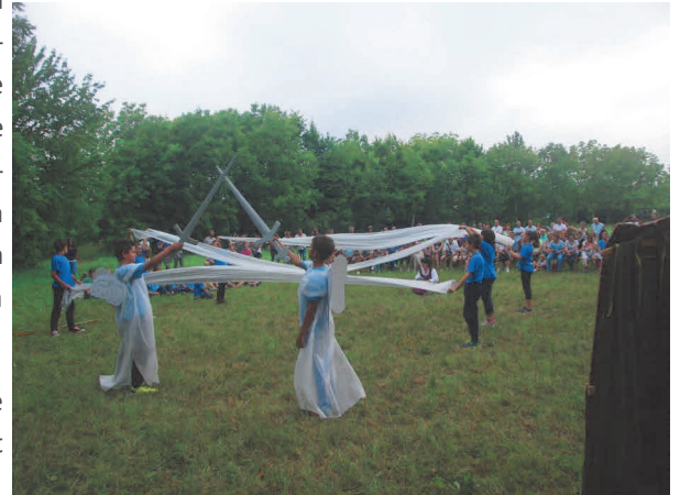
Vea di Sant Zuan

- 23 giugno – Vea di Sant Zuan con la rappresentazione Meni Fari e il Paradis nel bellissimo prato messoci gentilmente a disposizione dai proprietari in via Stradatta, essendosi reso impossibile lo svolgimento al Partidour per la presenza di campi militari. La nuova location si è rivelata adatta a permettere la partecipazione di un pubblico decisamente più numeroso del solito. Gli attori (i nostri bambini), consapevoli di ciò, ce l'hanno messa proprio tutta per raccontare la fiaba friulana appartenente al ciclo delle storie di Sant Pieri e il Signour. La rappresentazione è stata arricchita anche dalla